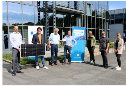
Auszeichnung Rolf Fensterbau in Hennef

Kurz vor den Sommerferien wurden zwei weitere Unternehmen im Rahmen der Solarkampagne Rhein-Sieg ausgezeichnet. „Wir sind begeistert, dass die Nutzung von Solarstrom nun auch bei Industrie und Gewerbe Fahrt aufnimmt“, lobte Rainer Kötterheinrich, Leiter des Amtes für Umwelt und Naturschutz des Rhein-Sieg-Kreises sowohl das Engagement des Meckener Unternehmens Brauweiler Fruchtsäfte als auch Rolf Fensterbau in Hennef. Letztere nahmen das Beratungsangebot der Energieagentur Rhein-Sieg an und haben sich vor der Installation umfassend und unabhängig informiert. Diesen Mehrwert bietet die Solarkampagne interessierten Unternehmen im Rhein-Sieg-Kreis übrigens auch. Auch die Stadtverwaltungen freuen es, dass mehr und mehr Unternehmen auf Solarstrom setzen. Meckener Bürgermeister Holger Jung und Hennefs Bürgermeister Mario Dahm waren bei den Auszeichnungen gerne dabei. Die Kampagne wird zunächst bis zum Jahresende fortgeführt.