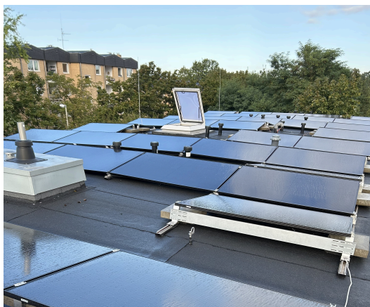
PV-Anlage auf dem Dach des Vereinsheims des Rot-Weiß Lessenich e. V.